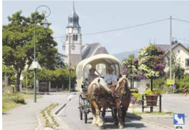
Transporte werden mit der Kutsche durchgeführt.